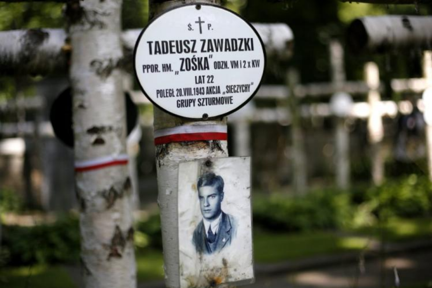
Grób Zośki na Powązkach